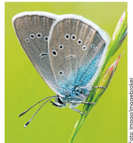
Der Wiesenknopf-Ameisenbläuling ist Schmetterling des Jahres.