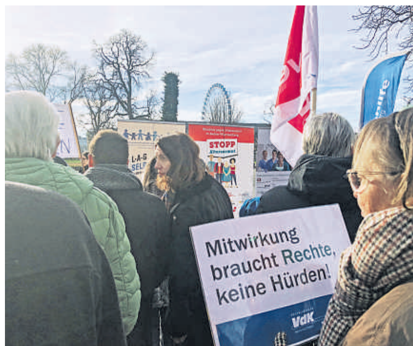
Für die Rechte der Pflegebedürftigen: Große Demonstration vor dem Landtag gegen das neue Pflegegesetz TPQG.

Unsere VdK-Forderung: Erhaltet die Landesheimmitwirkungsverordnung, damit die zentralen Rechte der Heimbeiräte im Gesetz verankert bleiben! Der Gesetzentwurf sieht vor, dass die Einrichtung