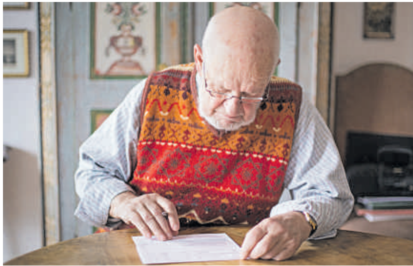
Viele schrecken vor den komplizierten Anträgen zurück, obwohl sie einen Sozialleistungsanspruch haben.

Noch bemerkenswerter ist das Verhältnis bei der Grundsicherung im Alter. Laut Bericht rangiert die Quote der Nichtinanspruchnahme hier zwischen 58 und 88 Prozent.