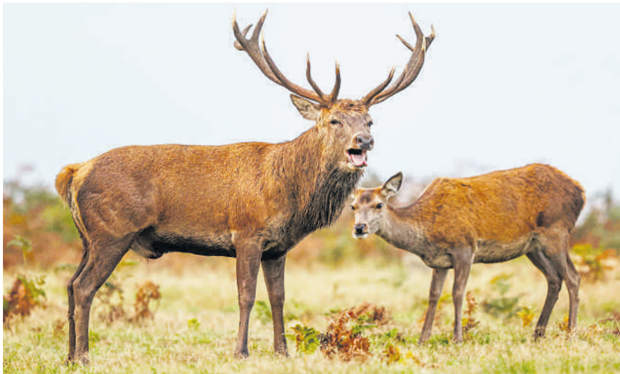
Zum Wildtier des Jahres wurde der Rothirsch gekürt. Die männlichen Tiere können eine Schulterhöhe von etwa 150 Zentimetern erreichen und bis zu 250 Kilogramm wiegen.

Fisch des Jahres ist der Europäische Wels. Mit dieser Wahl machen der Deutsche Angelfischerverband,