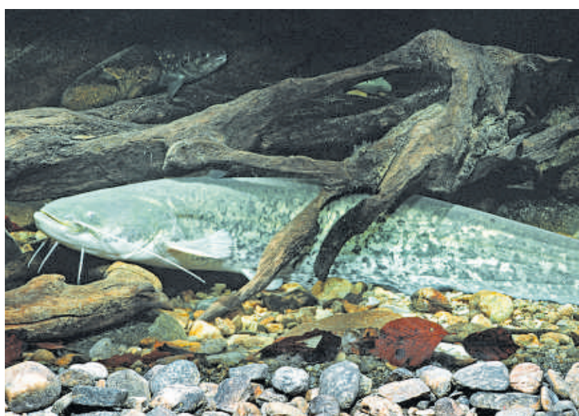
Der Europäische Wels ist der Fisch des Jahres.