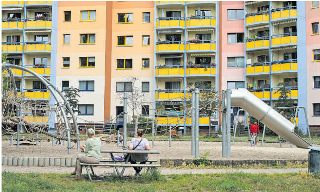
Die geplanten Kürzungen bei den Wohnkosten sieht der VdK sehr kritisch.

Wer dreimal Termine beim Jobcenter versäumt, würde als nicht erreichbar eingestuft und seinen Anspruch auf Leistungen komplett verlieren. Das Amt könnte theoretisch in einem kurzen Zeitraum Termine anberaumen. Ob die Person diese nicht wahrnehmen kann,