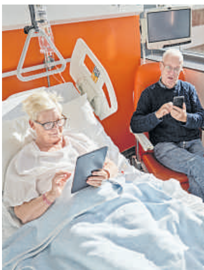
Der mobile Ratgeber fürs Krankenhaus.