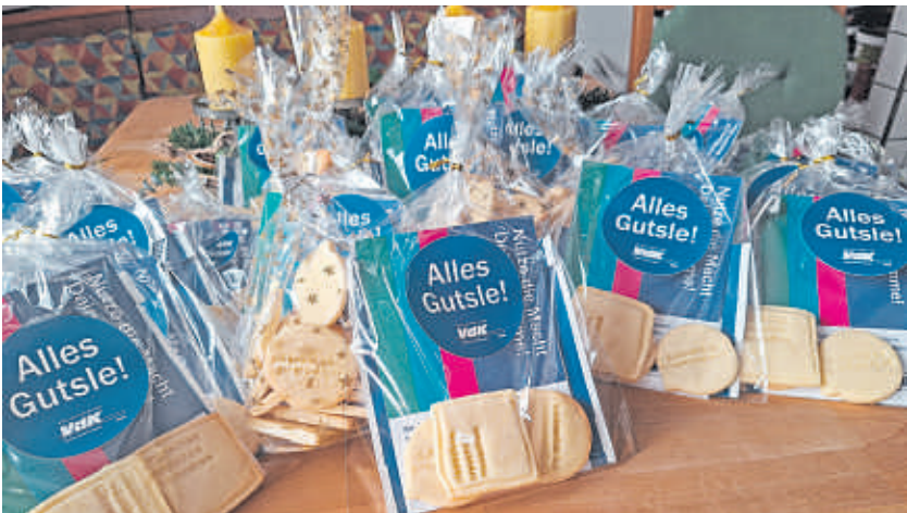
„Solidarität ist unverhandelbar!“ und „Menschen brauchen Menschen.“: Diese Slogans prangen anlässlich der Landtagswahl 2026 auf den VdK-Keksen. Auch der Ortsverband Dossenheim beteiligte sich an der Back-Aktion und verteilte die Kekse zur Probeverkostung bei einem Pfalz-Ausflug im November. Bis zur Landtagswahl im März werden noch weitere Kreis- und Ortsverbände fleißig backen und damit die VdK-Forderungen unterstreichen!