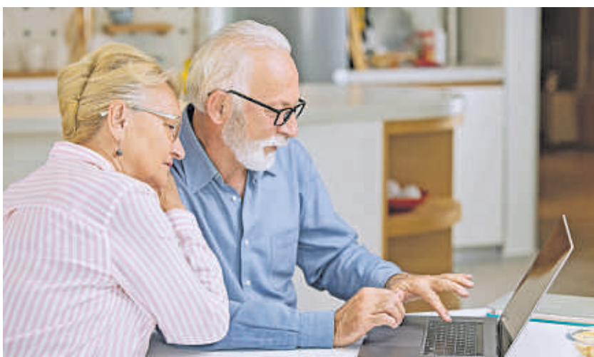
Die DRV fragt niemals per E-Mail, SMS oder Telefon nach Geld oder sensiblen Daten.