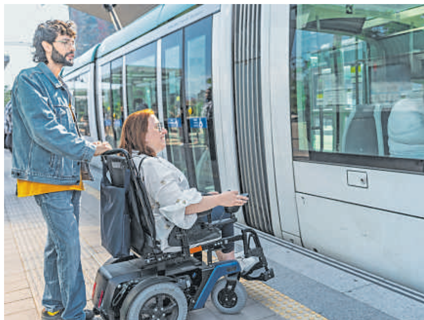
Barrierefrei zugängliche Bahnen und Busse müssen nach Ansicht des Sozialverbands VdK Standard sein.