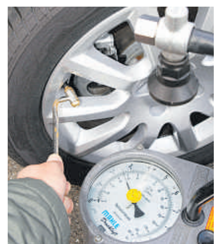
Der Reifendruck sollte regelmäßig überprüft werden.

Jährlich ereignen sich in Deutschland laut Statistischem Bundesamt etwa 1000 Verkehrsunfälle aufgrund von Mängeln an der Bereifung, dazu zählt auch ein falscher Reifendruck. Ist dieser 0,5 bar unter dem Sollwert, hat das bereits einen spürbaren Einfluss auf das Lenkverhalten des Autos. Die Kurvenlage verschlechtert sich, das Auto kann untersteuern und das Heck ausbrechen, außerdem verlängert sich der Bremsweg. Darüber hinaus steigt der Rollwiderstand, was den Reifenverschleiß sowie den Kraftstoffverbrauch erhöht.