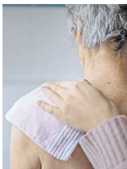
Hedwig K. ist stark dement und braucht Hilfe bei der Körperpflege.

Im Laufe der Jahre verschlechterte sich die gesundheitliche Verfassung der Frau weiter und ihr Pflegebedarf wuchs. Um schneller helfen zu können, organisierte die Familie schließlich einen Umzug des Seniorenpaars, sodass diese in demselben Haus wie ihre pflegenden Angehörigen wohnten. In der Wohnung waren allerdings Umbauten notwendig. Der Sohn stell-