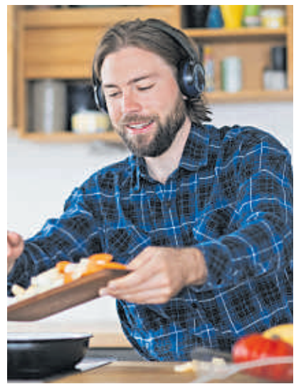
Legere Kleidung und Karos passen gut zusammen.

In Kombination mit Jeans oder als Oversize-Hemd wirken Karos lässig und entspannt auf andere. Zudem kommen Karos nie aus der Mode. Die Muster auf Hemden, Blusen, Röcken und Hosen sind ein zeitloser Klassiker bei Frauen und Männern. Selbst in Jugendkulturen wie Punk und Grunge waren