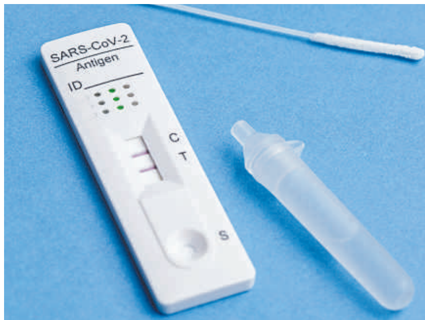
Einige Tage nachdem ein Bewohner sie angieniest hatte, fiel Christine Bihns PCR-Test positiv aus.

Sie habe sich aus Sorge vor einer Ansteckung desinfiziert und testen lassen. Während ihr PCR-Test negativ ausfiel, war der des Bewohners positiv. Einige Tage später ergab ein weiterer Test bei ihr, dass sie sich doch infiziert hatte.