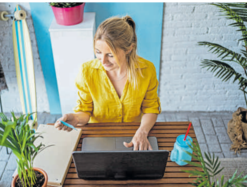
Wer nachhaltig online einkaufen möchte, tut sich auf vielen Plattformen oft schwer, geeignete Angebote zu finden.