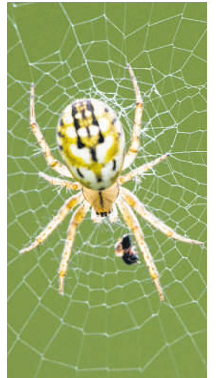
Spinne des Jahres ist die Streifenkreuzspinne.