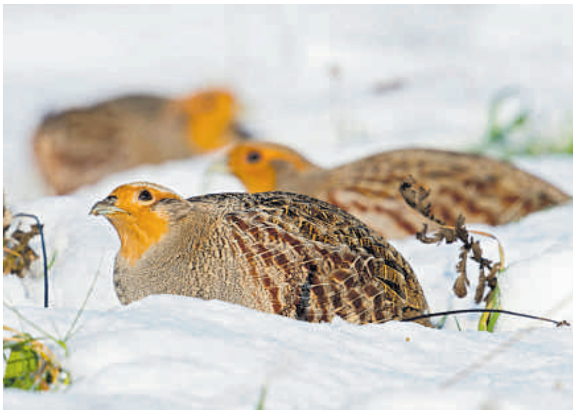
Vogel des Jahres ist das Rebhuhn.