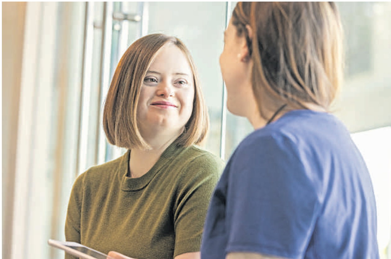
In einem Medizinischen Zentrum für Erwachsene Menschen mit Behinderung (MZEB) gelingt der ganzheitliche Blick auf den Menschen und die medizinische Geschichte.

Vom 18. Lebensjahr an gibt es im Landkreis Esslingen eine deutliche Versorgungslücke für Menschen mit einer geistigen Behinderung: Bis zur Volljährigkeit ist die medizinische Versorgung sehr gut über die Sozialpädiatrischen Zentren (SPZ) gewährleistet. Hier arbeiten multiprofessionelle Teams aus Ärztinnen, Therapeuten und Pflegekräften Hand in Hand. Nach demselben Prinzip sind die MZEB aufgebaut, dort gelingt der ganzheitliche Blick auf den Menschen und die medizinische Geschichte. Doch im Landkreis Esslingen gibt es kein MZEB, obwohl ihm mit über 530.000 Einwohnern eigentlich eines zusteht. Das mahnen wir seit Jahren an. Die Finanzierung der MZEB ist klar über das Sozialgesetzbuch geregelt, doch der Aufbau kostet Geld. Daran scheitern wir noch. Wir haben uns mit