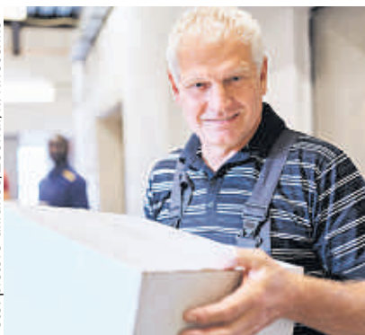
Länger arbeiten mit Aktivrente?