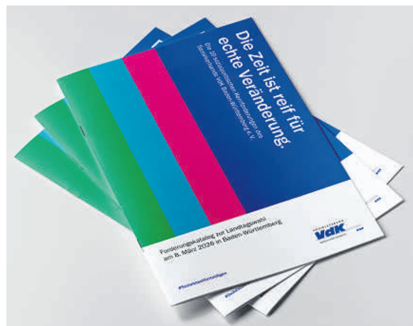
Der Forderungskatalog des Sozialverbands VdK Baden-Württemberg. Solidarität ist unverhandelbar!