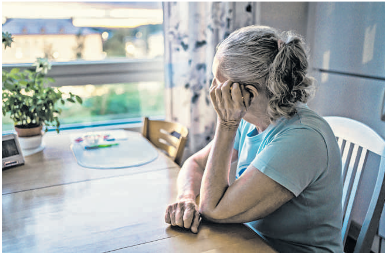
30 Prozent aller Erwachsenen in Baden-Württemberg fühlen sich einsam.

Wenn die eigenen sozialen Kontakte nicht ausreichen, sie nicht den persönlichen Bedürfnissen und Wünschen entsprechen, dann spricht man von Einsamkeit. Einsamkeit ist also ein subjektives Gefühl. Und dieses betrifft in Baden-Württemberg jeden dritten Menschen.