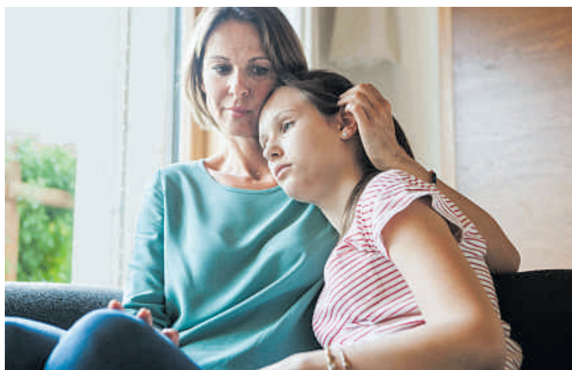
Angst- und Essstörungen sowie Depressionen werden für immer mehr junge Mädchen zu Problemen.

DAK-Vorstandschef Andreas Storm spricht von einer neuen Dimension psychischer Erkrankungen bei Jugendlichen. Die leise Hoffnung auf einen Rückgang sei nicht eingetreten. „Wir müssen aufpassen, dass wir nicht einen Teil dieser Generation verlieren“,