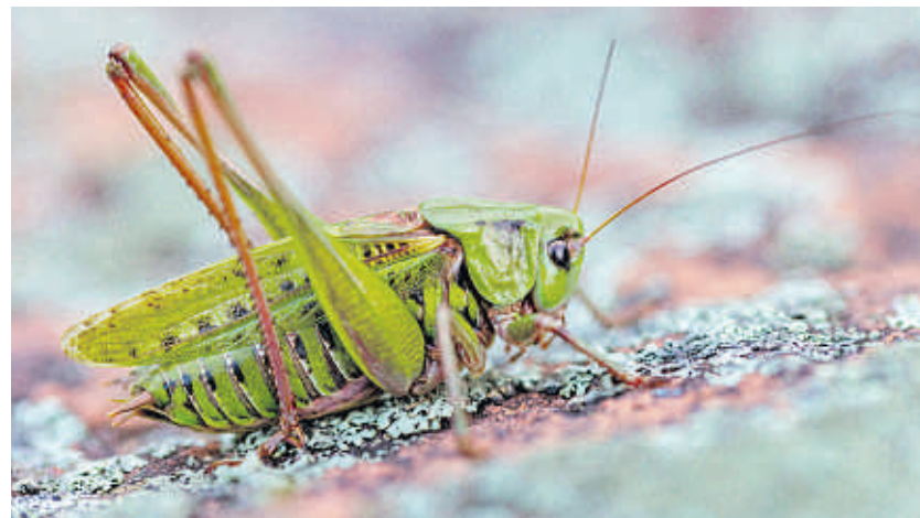
Der Warzenbeißer hat sich bei der Wahl zum Insekt des Jahres gegen die Konkurrenz durchgesetzt.