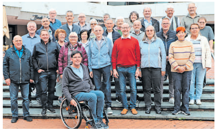
Bad Buchau: Klausurtagung des Kreisverbands Aalen.