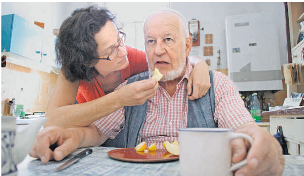
Ältere Menschen haben oft weniger Hunger und sind schneller satt.