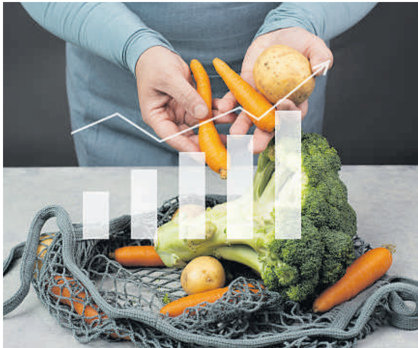
Verbraucherinnen und Verbraucher bekommen wegen gestiegener Preise immer weniger für ihr Geld.