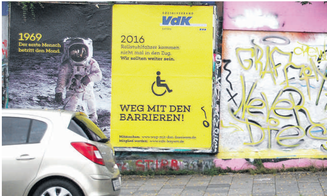
Vor zehn Jahren startete die VdK-Aktion „Weg mit den Barrieren!“. Großplakate machten darauf aufmerksam, wie hier in München.

Grünzinger weist bei den Rundgängen durch die Gemeinde und Städte auf viele für die Barrierefreiheit relevanten Punkte hin, egal ob fehlende Aufzüge, Leitsysteme für blinde und sehbehinderte