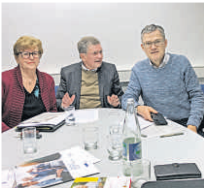
MdB Roderich Kiesewetter (rechts im Bild) beim Sozialverband VdK.

„Der VdK leistet seinen Beitrag für den Zusammenhalt unserer Gesellschaft und ist das soziale Gewissen unserer Region. Es war mir deshalb eine Freude, in Heidenheim beim Sozialverband zu Gast sein zu dürfen“, so Roderich Kiesewetter nach dem Gespräch. „Mir geht es um den Zusammenhalt unserer Gesellschaft. Der VdK leistet gerade dafür vorzügliches Engagement. Es sind ja nicht nur die 2,3 Millionen Mitglieder, sondern der Erfolg des VdK kommt