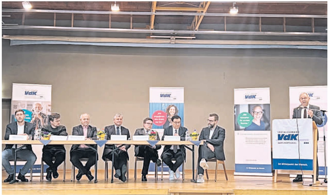
Beim Sozialverband VdK geht es gesellig zu – und dabei wird es auch immer mal wieder politisch. So wie hier beim Kreisverband Tauberbischofsheim im Januar bei einer Podiumsdiskussion anlässlich der Landtagswahl in Baden-Württemberg.

Ein Kaffeenachmittag mit dem Schwerpunkt Erste Hilfe : Das DRK informiert über Maßnahmen im Notfall bei Herzinfarkt und Schlaganfall – wichtiges Wissen, das Leben retten kann!