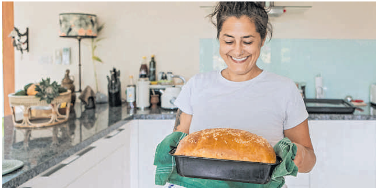
Wenn das Brot fluffig aus dem Ofen kommt und der Raum duftet, ist die Freude groß.

Das DBI hat noch mehr Brotwissen parat: „Bis vor 60 Jahren wurde stets mehr Roggen als Weizen geerntet und gemahlen. Seither stieg der Anteil des Weizens deutlich, während der Roggen rückläufig war. Viele Brotbäcker sorgen nun für eine Trendumkehr und backen Brote aus hundert Prozent Roggen und mit Roggensauerteig.“