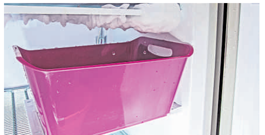
Die Eisschicht im Gefrierfach verwandelt sich in Schmelzwasser und wird von einer Wanne aufgefangen.