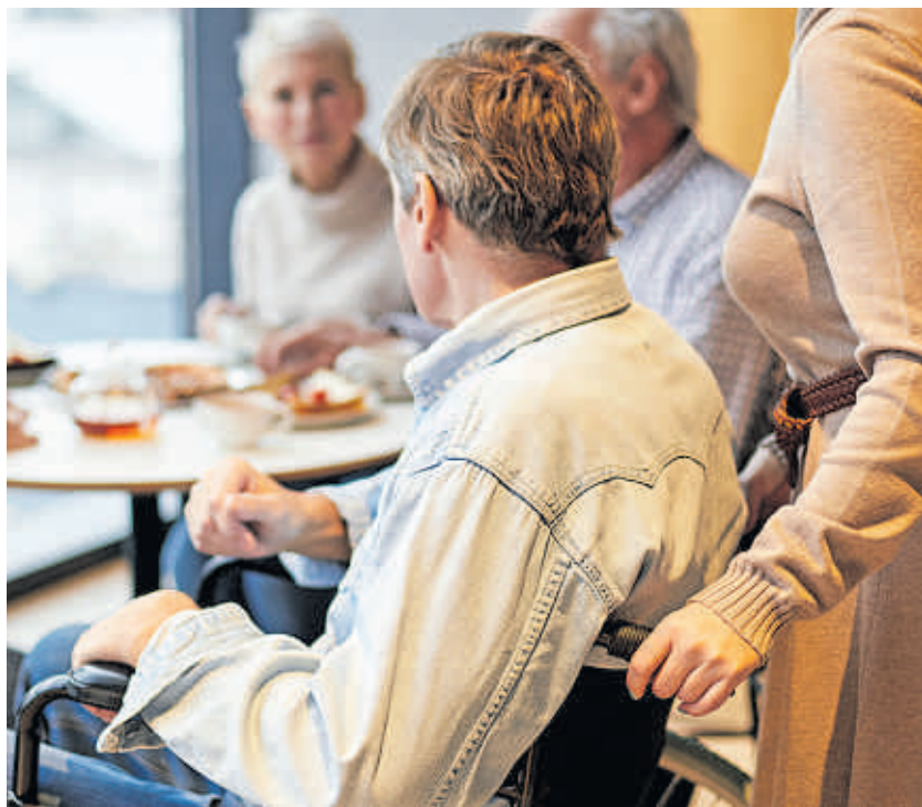
Die Pläne würden ermöglichen, dass ein Gastronom die Platzierung eines Rollstuhlfahrers in seinem Lokal ablehnen könnte.

Allerdings bleibt der Gesetzentwurf bei der konkreten Ausgestaltung weit hinter den Erwartungen zurück. Private Anbieter von Waren und Dienstleistungen werden nicht ausreichend in die Verantwortung genommen. Unklare Formulierungen im Gesetz könnten es Firmen ermöglichen, sich ihrer