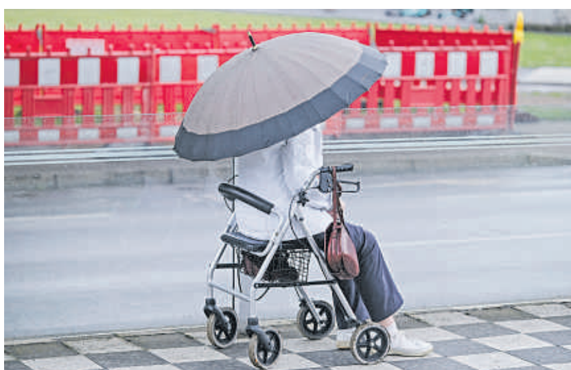
Rentnerinnen und Rentner, die lange für geringes Gehalt gearbeitet haben, sollen von der Grundrente profitieren.

Mit der Grundrente sollen Rentnerinnen und Rentner bessergestellt werden, die lange gearbeitet, dabei aber unterdurchschnittlich verdient und daher relativ niedrige Altersbezüge haben. Häufig ist der Grundrentenzuschlag jedoch kei-