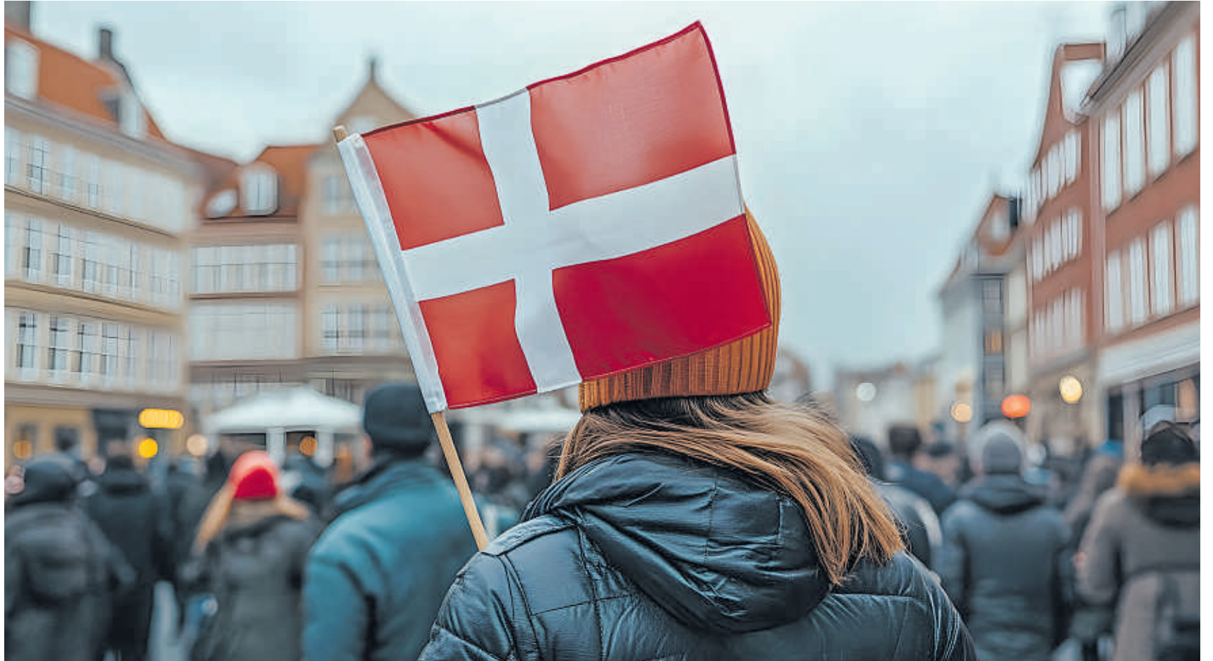
Positives Beispiel Dänemark: Dort gestalten die Kommunen aktiv die Pflege für ihre Bürgerinnen und Bürger.

Wohnraumanpassung bei der Pflege Seite 12