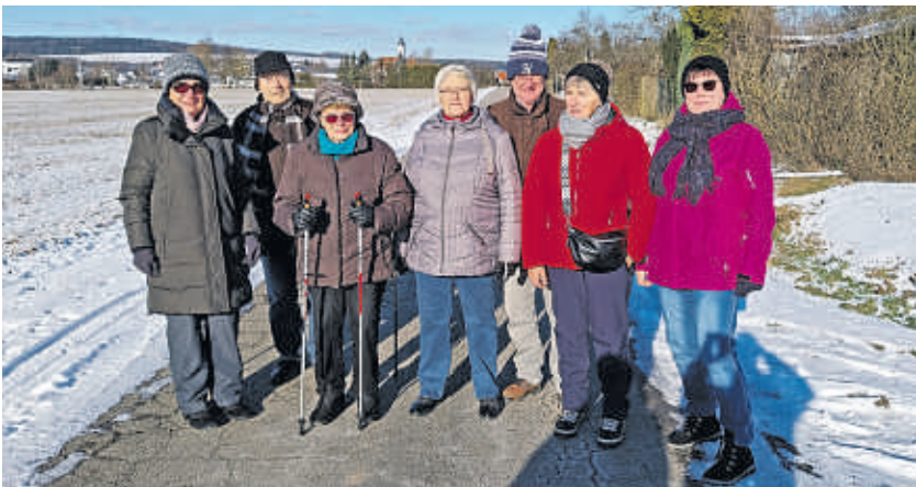
Gemeinsam gegen die Einsamkeit: Das ist das Motto des neuen monatli- chen Lauftreffs des Ortsverbands Dischingen. Spazieren gehen und danach in gemütlicher Runde Kaffee trinken und Kontakte knüpfen. Was für ein schönes Programm!