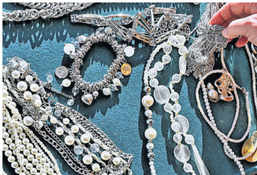
Perlen gibt es auch als Modeschmuck.