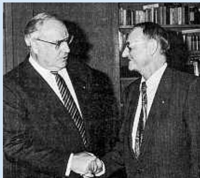
Walter Hirrlinger und Bundeskanzler Helmut Kohl.

Der VdK setzt 2009 die Rentengarantie durch. Rentenkürzungen sind dadurch ausgeschlossen.