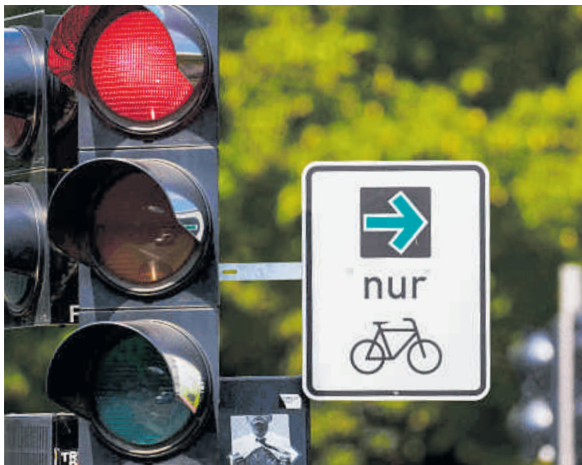
Der grüne Rechtsabbiegepfeil mit einem Fahrradsymbol gilt nur für Radfahrende.

Fährt man bei Rot über die Ampel, spielt bei der Bestrafung die Zeit eine Rolle. Ein „einfacher Rotlichtverstoß“ liegt vor, wenn die Ampel