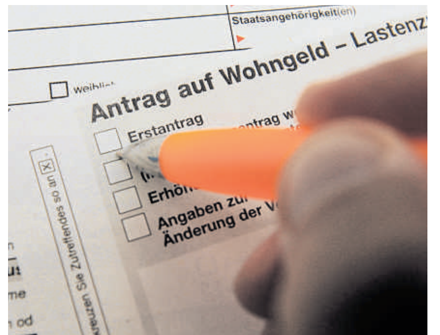
Um die Wohngeld-Anträge kümmern sich die örtlichen Behörden wie Landratsamt oder Stadtverwaltung.

Zuschuss, wenn die eigenen Einkünfte nicht ausreichen