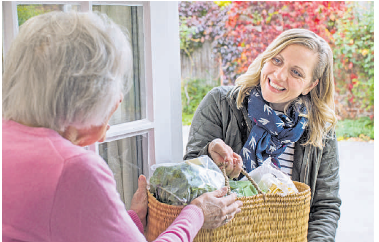
Pflege: Entlastung bringt auch, wenn die Nachbarin mal eben schnell einkaufen geht.

„Genau dafür haben wir jahrelang gekämpft!“, sagt Hans-Josef Hotz, Vorsitzender des Sozialverbands VdK Baden-Württemberg e.V. „Endlich erfährt auch die nachbarschaftliche, ehrenamtliche Hilfe in der häuslichen Pflege Wertschätzung und all die Pflegebedürftigen im Land haben einen deutlich einfacheren Zugang zum Entlastungsbetrag. Das ist ein großer Gewinn für die Nächstenpflege hier im Land!“