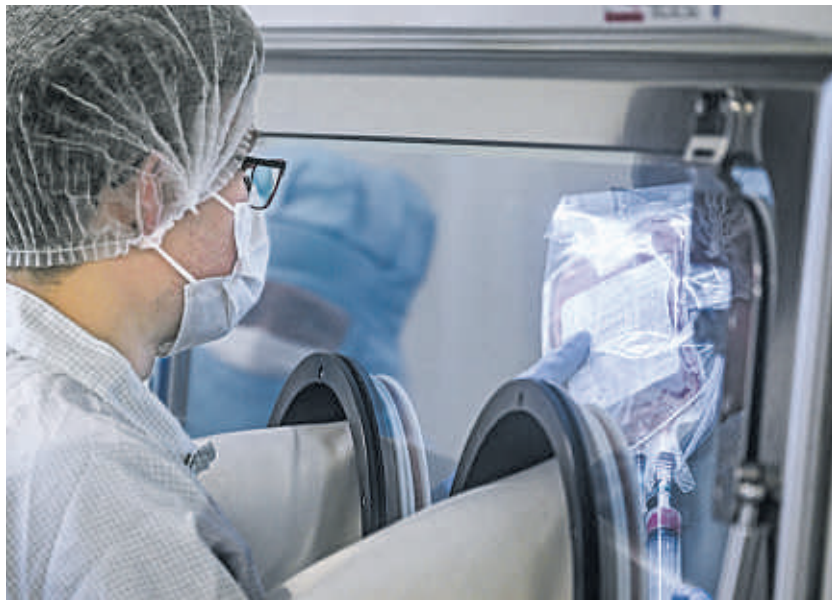
Nach der Entnahme werden die Blutstammzellen eingefroren und in Stickstoff bei rund -160 Grad gelagert.

Die Ärzte empfahlen der Patientin eine autologe Stammzelltransplantation, bei der Blutstammzellen entnommen werden, um sie nach einer hochdosierten Chemotherapie dem Körper wieder zuzu-