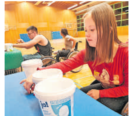
Spaß und Geschick auf der VdK-Freizeit 2021.

Jetzt schnell anmelden! Vom 15. bis 17. August 2025 findet das vierte inklusive Sportwochenende in der Sportschule Steinbach in Baden-Baden statt. Die Freizeit organisiert der Sozialverband VdK Baden-Württemberg e.V. in Kooperation mit der gemeinnützigen Gesellschaft zur Förderung des inklusiven Sports (gGfIS). Einzel- und Teamsportarten, wie Fußball, Rollstuhl-Basketball und Schwimmen, stehen auf dem Programm.