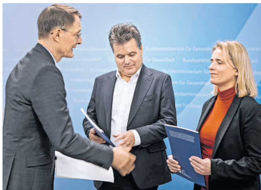
Gesundheitsminister Prof. Dr. Karl Lauterbach (links) überreicht den Aktionsplan an VdK-Präsidentin und DBR-Sprecherin Verena Bentele (rechts) und Behindertenbeauftragten Jürgen Dusel (Mitte).

Der Aktionsplan ist im Dialog mit den Verbänden im Deutschen Behindertenrat – darunter der So-