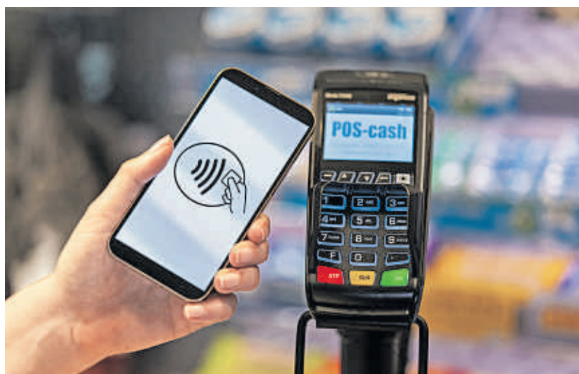
Das Wellensymbol zeigt an, ob bei einem Händler kontaktloses Bezahlen möglich ist.

Nicht nur Kreditkarten verdrängen das Bargeld, sondern auch Smartphones mit „Wallet“