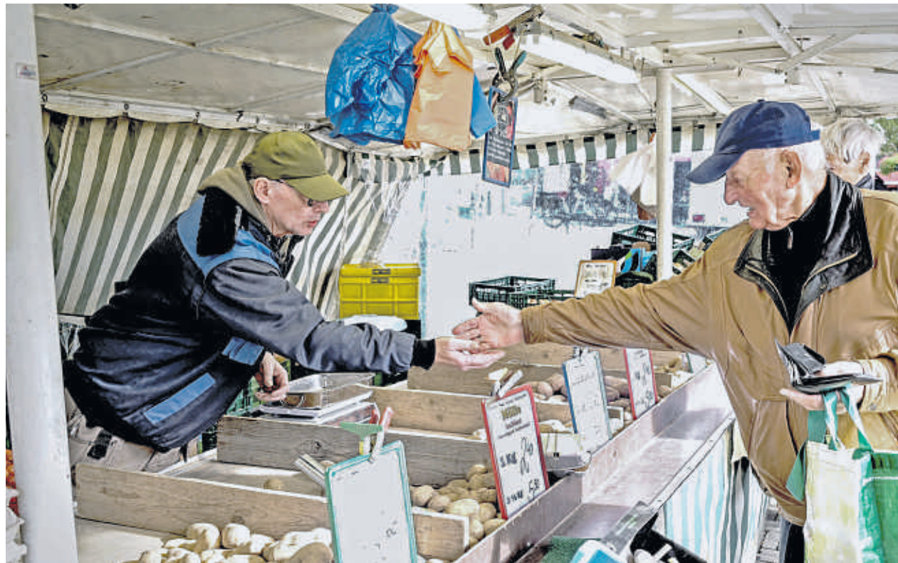
Selbstständige wie zum Beispiel Gemüsehändler haben oft eine unzureichende Altersvorsorge.

Etwa 3,6 Millionen Menschen sind nach Angaben des Statistischen Bundesamts hauptberuflich selbstständig tätig. Davon sind nur rund 330.000 in der gesetzlichen