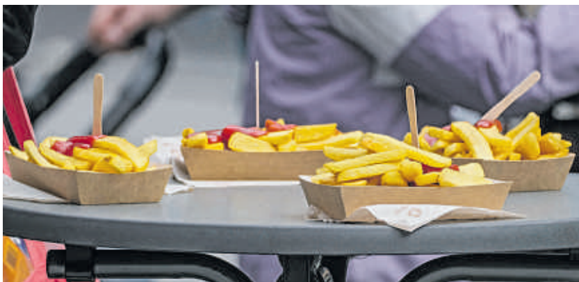
Fast Food aus Imbissbuden sollte bei einer gesunden Ernährung die Ausnahme sein.

Fazit: Hat der Arzt zu hohe Cholesterinwerte festgestellt, kann der Cholesterinspiegel nicht nur mit Medikamenten gesenkt werden. Eine Änderung des Lebensstils mit gesunder Ernährung und Bewegung trägt maßgeblich zur Herzgesundheit bei und sollte laut Deutscher Herzstiftung immer der erste Schritt sein. Informationen hierzu gibt es unter www.herzstiftung.de/ernaehrung Petra J. Huschke