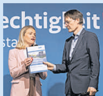
Verena Bentele und Bundesgesundheitsminister Karl Lauterbach.

Der VdK wächst beständig und hat zum Ende des Jahres 2024 mehr als 2,3 Millionen Mitglieder.