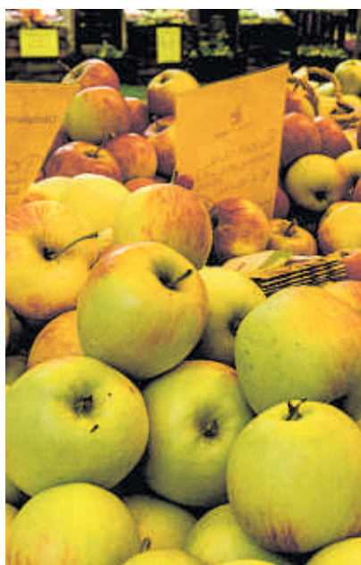
Äpfel aus der Region gibt es als Lagerware auch im Winter.

„In Deutschland wird Obst und Gemüse auf vielfältige Weise angebaut, von traditionellem Freilandanbau bis hin zu modernen Gewächshäusern“, heißt es bei der Verbraucherzentrale. Die wichtigsten Obstsorten hierzulande sind Äpfel, gefolgt von Erdbeeren. Beim Gemüse sind es Kartoffeln, Spargel, Möhren, Zwiebeln und Salate. Die klimafreundlichste Anbauweise sei der Freilandanbau – auf Feldern, Plantagen oder Streuobstwiesen. Als Lagerware bezeichnet man Gemüse und Obst, das bis