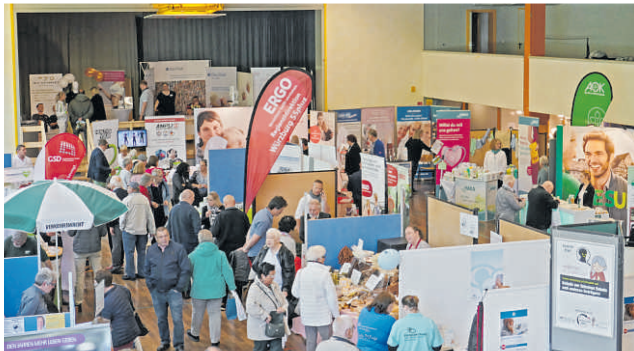
Dieses Jahr wieder: Die Gesundheitstage Main-Tauber-Kreis am 10. und 11. Mai!

Mi., 19. Februar, 11:00 Uhr Anmeldung erforderlich! www.vdk-bw.de/angebote/webseminare/