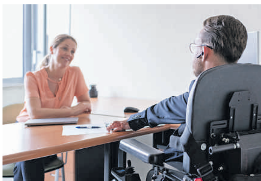
Eine Checkliste hilft Unternehmen bei der Umsetzung der wichtigsten Schritte auf dem Weg zum inklusiven Recruiting.

Inklusives Recruiting soll Chancengleichheit schaffen und Barrieren im Bewerbungsprozess abbauen! Dies beginnt mit einer Analyse des Ist-Zustands im jeweiligen Unternehmen: Welche Anforderungen stellt das Unternehmen an Mitarbeitende? Wie inklu-