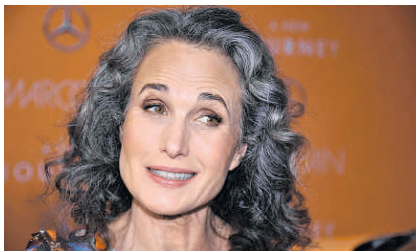
Steht zu ihren grauen Haaren: Schauspielerin Andie MacDowell.