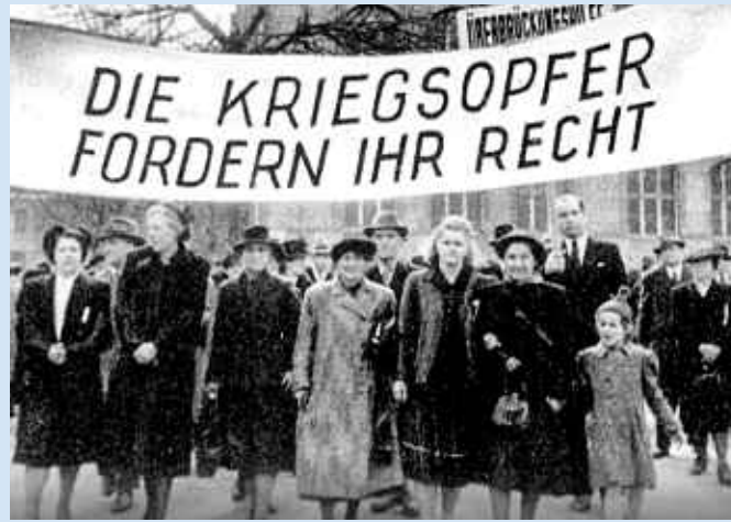
„Der Marsch auf Bonn“ 1963.

Die Witwenrente wird auf 60 Prozent der vom Verstorbenen bezogenen Rente erhöht.