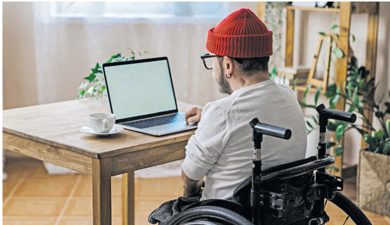
Menschen mit Behinderung sind häufiger auf Stellensuche als andere Erwerbstätige.

Immer mehr Unternehmen kommen ihrer gesetzlichen Pflicht nicht nach, Menschen mit Behinderung zu beschäftigen. Der Anteil der Betriebe, die die vorgegebene Fünf-Prozent-Quote vollständig erfüllen, ist auf einen Tiefstwert gesunken, wie aus dem Ende 2024 vorgestellten „Inklusionsbarometer Arbeit“ der Aktion Mensch und des Handelsblatt Research Institutes hervorgeht. Zwei von fünf Arbeitgebern beschäftigen weniger Schwerbehinderte als vorgeschrieben. Jedes vierte Unternehmen