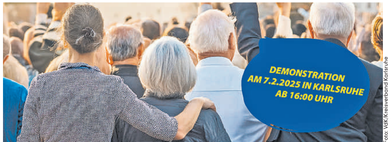
Ihre Teilnahme zählt: Mitmachen und gemeinsam für eine bessere Zukunft eintreten!