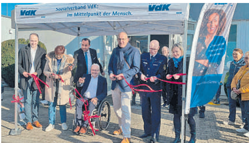
Und durch: Feierliche Neueröffnung der Geschäftsstelle in Schwäbisch Gmünd und Tag der Offenen Tür.

Der Tag der offenen Tür bot den zahlreichen Gästen die Möglichkeit, sich direkt zu den Angeboten des Verbands beraten zu lassen und den VdK in einem festlichen Rahmen kennenzulernen. red