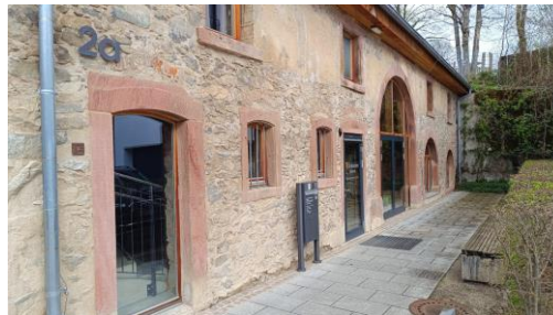
Talvogtei 2a 79199 Kirchzarten

An die Teilnehmenden Rollstuhl und Rollator Training 20.04.2024 von 10 -16 Uhr Kirchzarten , Bürgersaal Talvogtei 2a