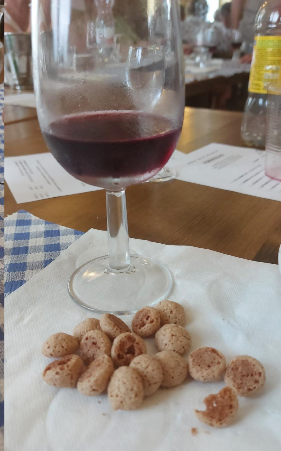
Dann kehrten wir zu einer Weinprobe ein